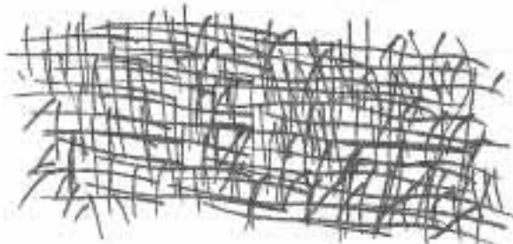
Wissensnetz: symbolisiert die Ver-BIND-ungen von Wissensseinheiten

Besonders spannend ist die Suche nach EXFORMATION. Dieser von NØRRETRANDERS geprägte Begriff beschreibt